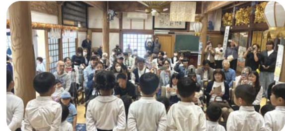
降誕会発表会 園児が歌いました 5/9