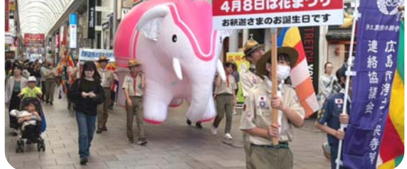
花まつりパレード お釈迦さまのご誕生をお祝いして本通りを行進しました 4/5