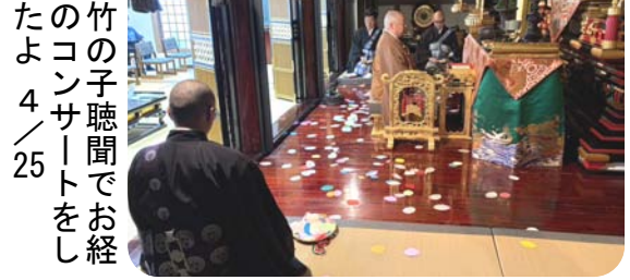
竹の子聴聞でお経のコンサートをしたよ 4/25