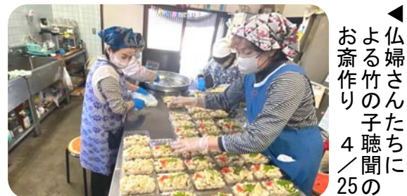
仏婦さんたちによる竹の子聴聞のお斎作り 4/25の