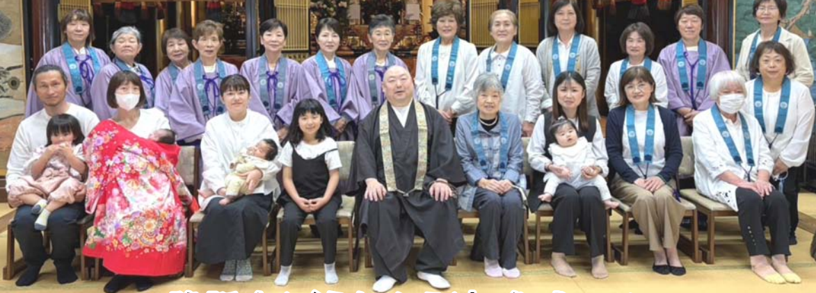
降誕会(ごうたんえ)初参式 5/9